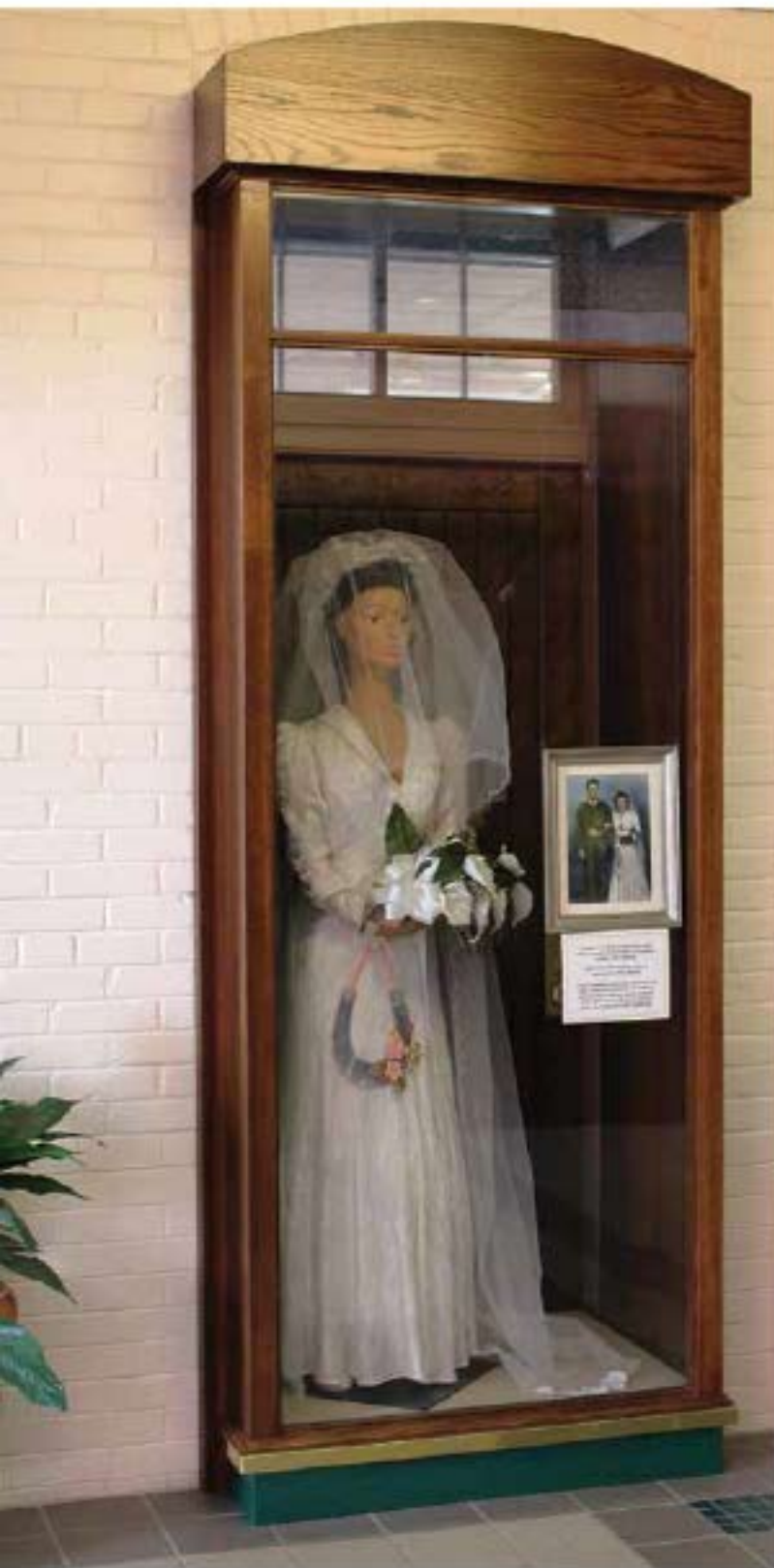
Display cabinets were built into old doorways in the annexes to give building visitors a foretaste of the museum galleries. This is the only "facial features" mannequin in the museum, and was personally selected by the bridal dress owner. Les annexes vitrées ont été aménagées dans les anciennes entrées du manège militaire pour donner aux visiteurs un avant-goût des salles du musée. Ce mannequin, le seul du musée comportant des traits faciaux, a été choisi personnellement par la propriétaire de la robe de mariée.

prairies as a resistance and not a rebellion. That this was factually a resistance by a significant fraction of the population to the territorial encroachment of the Canadian government is undeniable, but legally it was a rebellion. I noted that the Irish have no difficulty continuing to call the events of 1916 the "Easter Rebellion". As it happens, at the time in another display the Canadian War Museum had no difficulty with calling the American troops who invaded Canada in 1775 "rebels". As with Ireland in 1916 and the Thirteen Colonies in 1775, Riel commenced an armed insurrection with a revolutionary declaration. In my view, calling the events of 1885 a "resistance" detracts from the integrity and daring of Riel's stance.