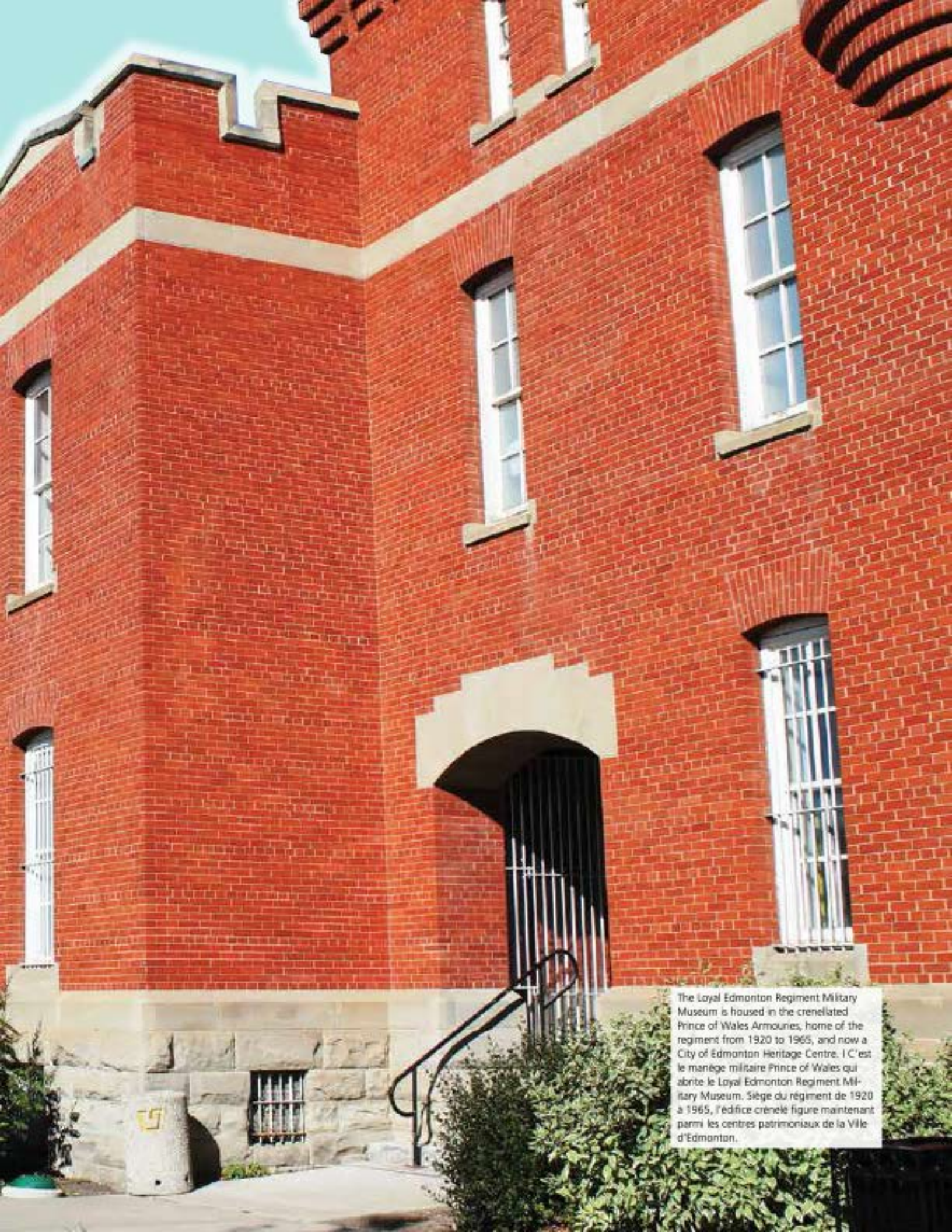
The Loyal Edmonton Regiment Military Museum is housed in the crenellated Prince of Wales Armouries, home of the regiment from 1920 to 1965, and now a City of Edmonton Heritage Centre. C'est le manège militaire Prince of Wales qui abrite le Loyal Edmonton Regiment Military Museum. Siège du régiment de 1920 à 1965, l'édifice crénelé figure maintenant parmi les centres patrimoniaux de la Ville d'Edmonton.